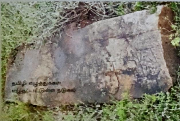
தமிழி எழுத்துக்கள் எழுதப்பட்டுள்ள நடுகல்

இலங்கையில் ஏறத்தாழ 2000இற்கு மேலான பிராமிச் சாசனங்கள் கிடைத்துள்ளன. அவற்றில் பிராகிருதச் சொற்களுடன், தமிழ் மொழிச் சொற்களும் காணப்படுகின்றன. 'கி.மு முதல் மூன்று நூற்றாண்டுகளில் இலங்கையில் தமிழ் ஒரு பேச்சு மொழியாக