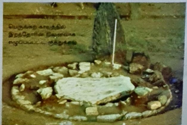
பெருங்கற் காலத்தில் இறத்தோரின் திணைவாக எழுதப்பட்ட நடுகல்